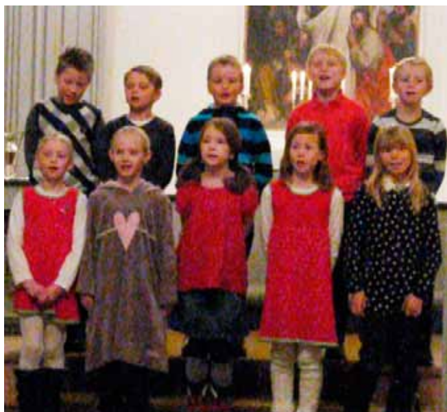
3. klasse ved Sandvollan skole sang fint og var gode representanter for skolen sin. (Foto: May Bente Bigset Skogset).